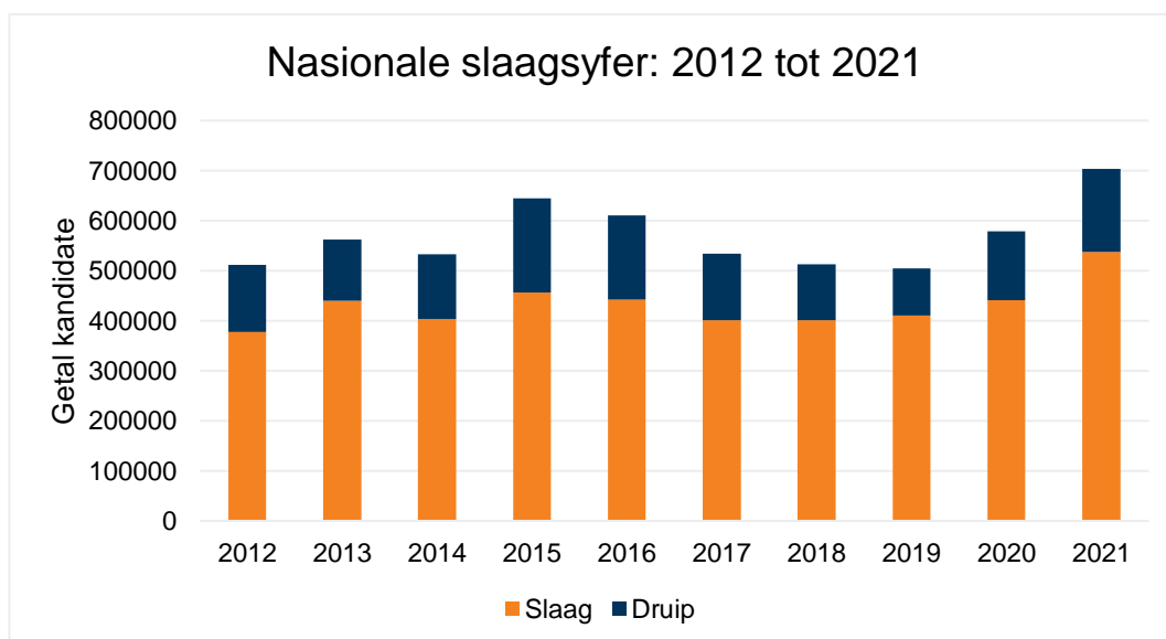
Grafiek 1: Nasionale slaagsyfer: 2012 tot 2021

Ten spyte van baie uitdagings die afgelope twee jaar, is die nasionale slaagsyfer van 76,4% baie naby aan dié van 2020 en moet die matriekklas van 2021 geluk gewens word met hul goeie prestasie.