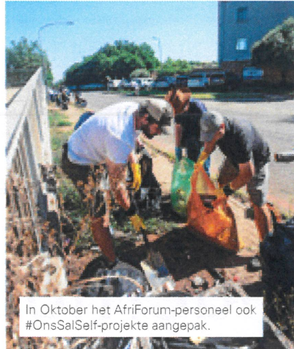
In Oktober het AfriForum-personeel ook #OnsSalSelf-projekte aangepak.

AfriForum en ons susterorganisasies in die Solidariteit Beweging het reeds goed gevorder om op hierdie wyse 'n de facto-bedelingsverandering teweeg te bring sonder om bakhand te wag vir enige aalmoese van die sentralistiese ANC-regering. Ons Beweging het met 'n #OnsSalSelf-ingesteldheid reeds gehelp om nuwe werklikhede te skep. Dit is gedoen met die vestiging van talle volhoubare, sterk en selfstandige plaaslike en kultuurgemeenskapsinstellings soos Akademia, Sol-Tech, die Skole-ondersteuningsentrum (SOS), Solidariteit